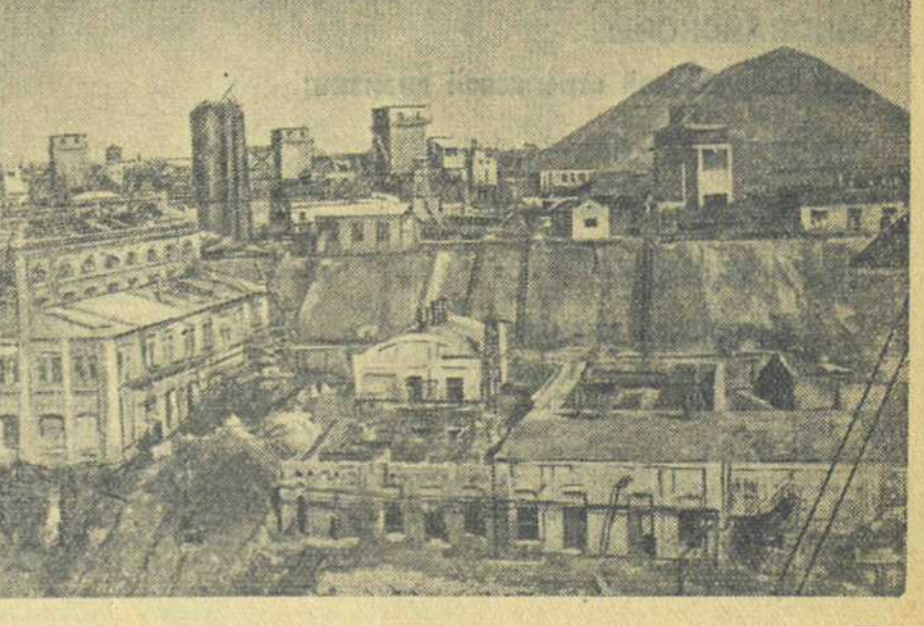
3. Шахта «Центральное Имение».